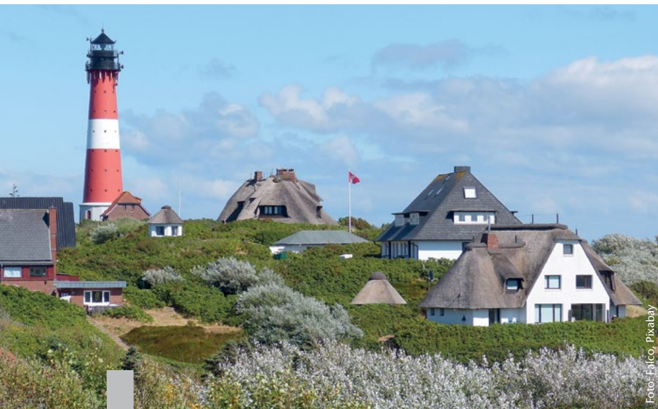
Die Ferienvermietung an den schönsten Orten Deutschlands – wie hier in Hörnum auf Sylt – ist ein wesentlicher Teil der Wertschöpfung.

Der inländische Tourismus hat im Jahr vor der Coronakrise 124 Milliarden Euro erwirtschaftet und damit vier Prozent der Wertschöpfung Deutschlands. Die Jahre 2020 und 2021 waren, bedingt durch die Coronapandemie, die umsatzschwächsten seit Beginn der Zählung im Jahr 1994. Vor der Pandemie im Jahr 2019 gaben Reisende für touristische Waren und Dienstleistungen innerhalb Deutschlands noch 330 Milliarden Euro aus, 2021 waren es gut 40 Prozent weniger.