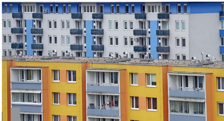
Um dem Wohnungsengpass entgegenzuwirken, wird alles gebraucht: Mietwohnungsbau, sozialer Wohnungsbau, Eigenheimbau und der Bau von Eigentumswohnungen.

Der Wohnraum wird knapp – vor allem in Großstädten, Ballungszentren und Universitätsstädten, mittlerweile aber auch in 138 Städten und Kreisen. Zwischen 2010 und 2015 sind die 78 Großstädte in Deutschland um mehr als 1,2 Millionen Einwohner beziehungsweise um 4,9 Prozent gewachsen. Der Mieterbund fordert eine Vervierfachung des Mietwohnungsbaus. Auch der soziale Wohnungsbau dürfe in der nächsten Legislaturperiode nicht vernachlässigt werden, sondern müsse auf hohem Niveau fortgesetzt werden. Die Bausparkassen gehen davon aus, dass Mietwohnungen allein die Probleme nicht lösen können. Junge Familien seien die Verlierer der galoppierenden Immobilienpreise in den Ballungsräumen. Für diese sollte der Bau eines Eigenheimes oder der Erwerb einer Eigentumswohnung erleichtert werden. Immobilieneigentum dient überdies der Altersvorsorge, denn mietfreies Wohnen im Alter kompensiert einen Teil der immer niedriger werdenden Renten. Außerdem macht jeder Umzug in eine eigene Wohnung eine andere Wohnung frei. Fazit: Es gibt nicht nur eine Lösung für den Wohnungsmarkt, sondern viele Schrauben, an denen gedreht werden kann.